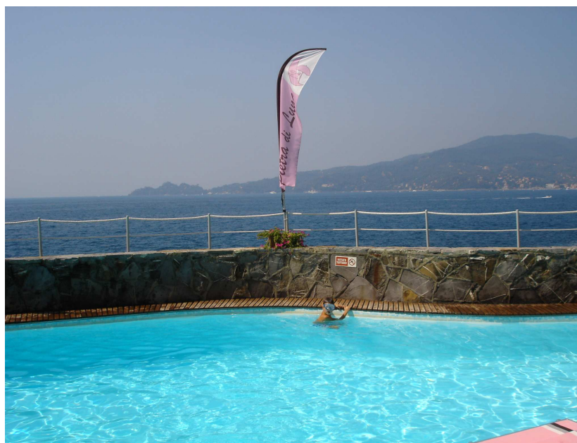
Bagni “Pietra di Luna” e sullo sfondo Portofino !