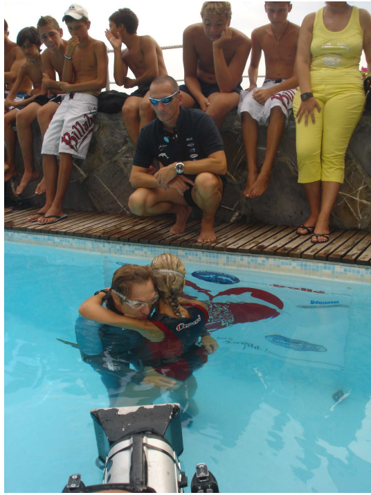
Gli ultimi momenti prima del bacio da record